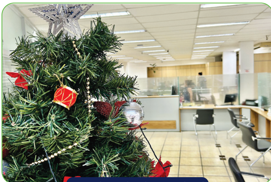
Recepção da Jucesp decorada com árvore de Natal

De segunda a sexta-feira, das 8h às 16h.