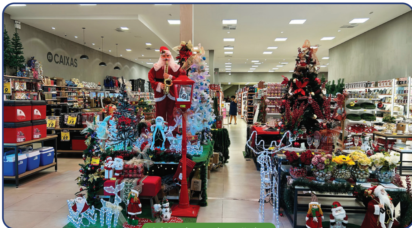
Loja de Sorocaba preparada para o Natal 2023

Para motivar as compras dos consumidores no comércio varejista de Sorocaba, o Sincomercio Sorocaba está promovendo a divulgação em suas redes sociais de motivação à população.