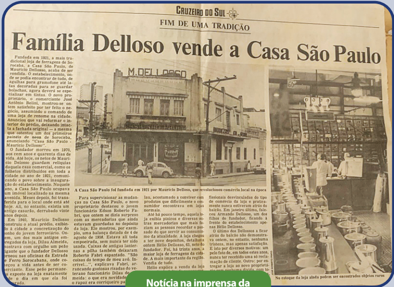
Notícia na imprensa da venda da Casa São Paulo