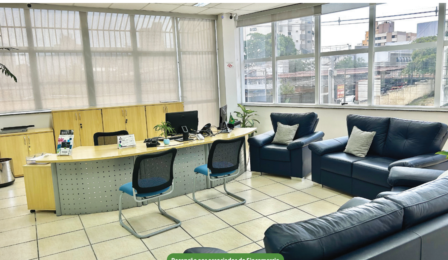
Recepção aos associados do Sincomercio

MUITOS EMPRESÁRIOS DO COMÉRCIO VAREJISTA DE SOROCABA AINDA NÃO CONHECEM AS INSTALAÇÕES DA ENTIDADE PATRONAL QUE REPRESENTA A CATEGORIA JUNTO AOS ÓRGÃOS PÚBLICOS, TRABALHISTAS, SINDICATOS DOS EMPREGADOS E OUTRAS ENTIDADES.