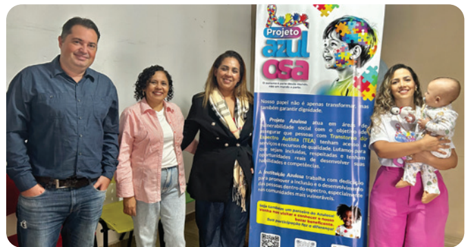
Voluntários e diretoria

O Instituto Azulosa segue escrevendo sua história todos os dias, com novos projetos, novas parcerias e o compromisso de ampliar cada vez mais o alcance de sua missão: informar, apoiar e transformar vidas.