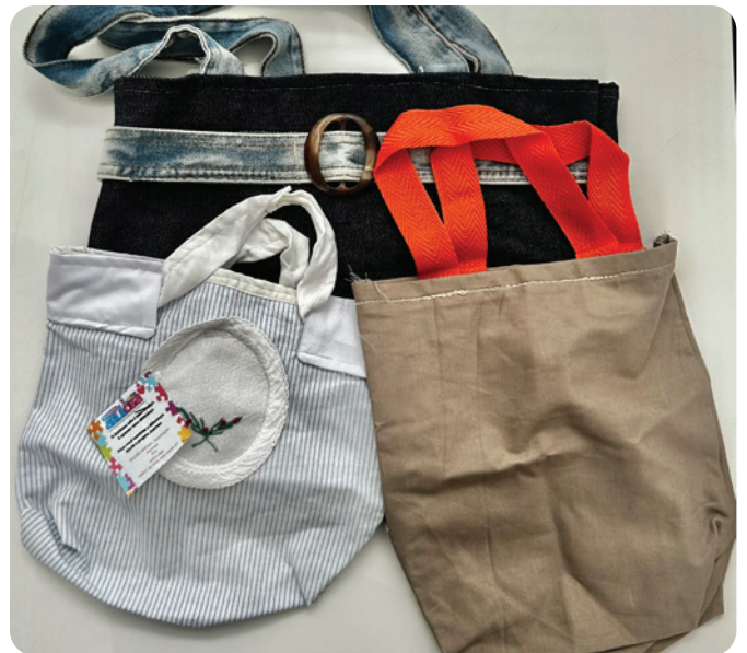
Produtos disponíveis no bazar e feitos por alunos.