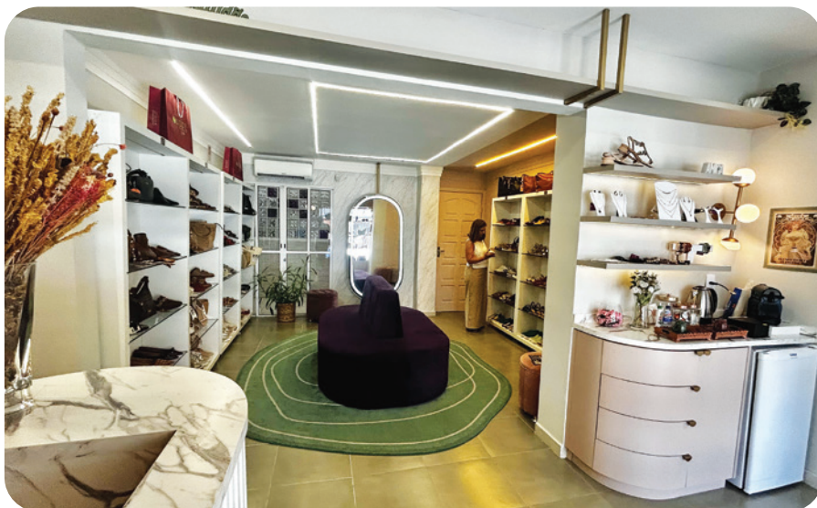
Loja moderna e ampla