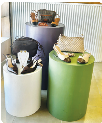
Variedade e preços atrativos