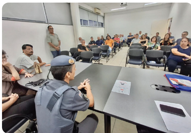
Comerciantes e convidados do evento