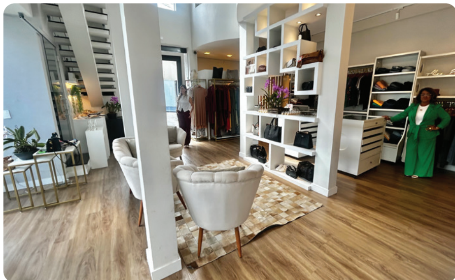
Vista da moderna Boutique

Localizada na Rua Rubino de Oliveira, na Vila Carvalho, a boutique oferece ainda um diferencial de acolhimento: petiscos, sucos, tortas e doces são servidos como cortesia, proporcionando uma experiência agradável e personalizada às clientes.